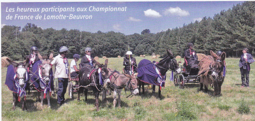
Les heureux participants aux Championnats de France de Lamotte-Beuvron

Chaque discipline demande des qualités tant chez le meneur que chez les ânes. Pour ces derniers, ceux qui montrent le plus de tempérament, une fois bien éduqués et bien entraînés, deviendront sûrement de bons