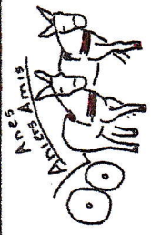
Tableau à adresser à Nicole GOMEZ 19 rue des Tumuli 45340 CHAMBON LA FORET LeVieux 1.9.18

Association Anes Aniers Amis Contact : 06 08 03 04 30